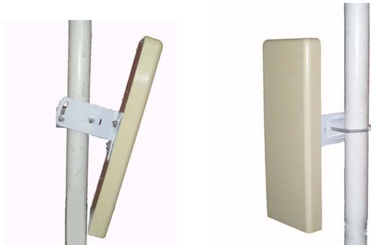
Антенна RFE 2400/90/14

Секторная антенна RFE 2400/90/14 предназначена для построения сетей передачи данных стандарта IEEE 802.11b/g. Используется в составе базового оборудования.